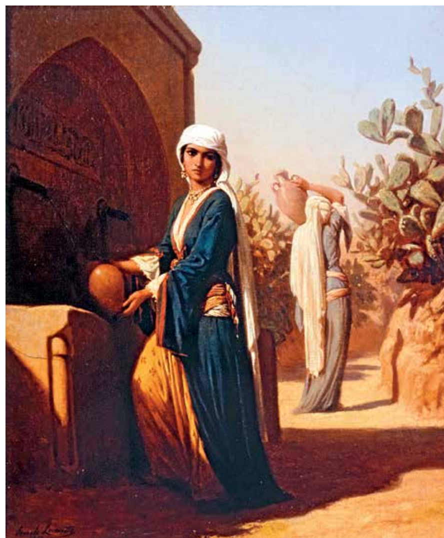
Vernet-Lecomte Emile (1821 – 1900) - Femmes maronites à la fontaine - 39 x 47 cm

Basée sur une observation minutieuse de leur environnement, ces artistes, dont l'enjeu esthétique entretient des liens étroits avec la photographie, laissent derrière eux un riche héritage pictural à plusieurs lectures. Les toiles n'offrent pas de possibilité d'interprétation mais elles reproduisent une correspondance de sensibilité à laquelle le spectateur ne peut qu'être sensible. 📍