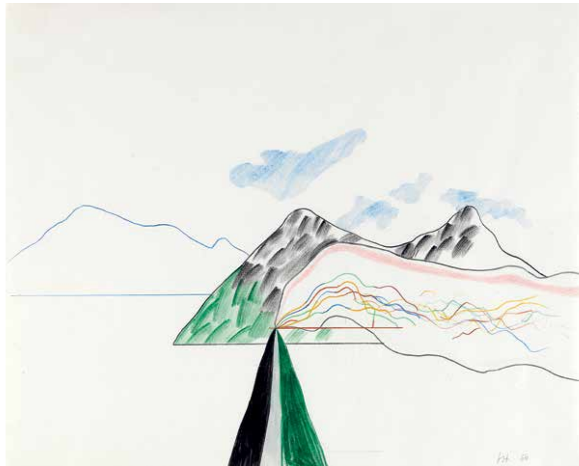
Hockney David (1937) - Montagne libanaise - 40 x 48.9 cm

Les œuvres rendent compte de la géographie levantine à travers des toiles détaillées et précises flattant notre identité, et par conséquent un pan de notre histoire et une part de notre personnalité.