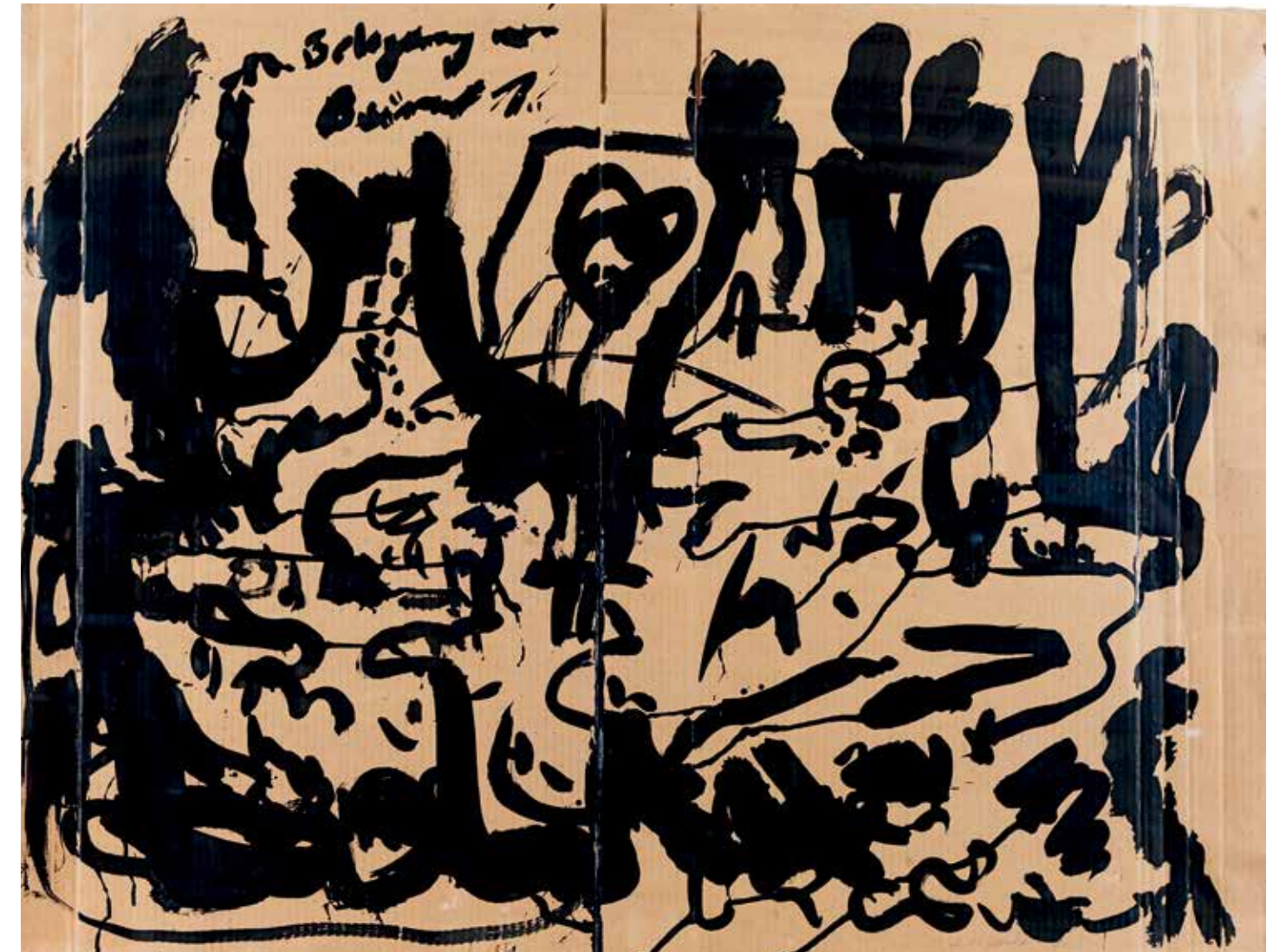
Penck A.R. (1939-2017) - Die Belagerung von Beirut, 1982 - acrylique sur carton ondulé- 90 x 120 cm

« A Tribute to Lebanon » assure un regard de découverte à la dixième édition de Beirut Art Fair, celui de la construction de l'image d'Orient, et plus précisément du Liban, depuis l'Europe. Son sens et sa dimension sont de proposer une véritable exposition de curiosité, au sens le plus noble du terme !