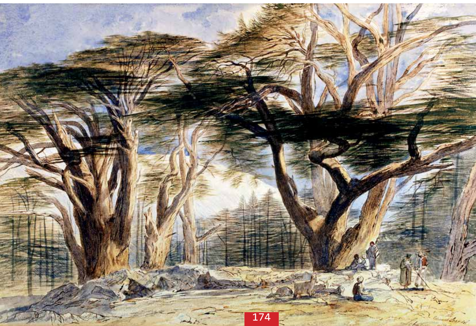
Lear Edward (1812 – 1888) - Vue des Cèdres du Liban - 38 x 55 cm

Le visiteur émerveillé flâne entre les aquarelles, deux automates fumant le narguilé réalisés par Léopold Lambert au XIX ème siècle (dont l'un a fait la couverture de la Gazette de l'Hôtel Drouot), les lampes (qui sont des bronzes de Vienne de la maison Bergman aux sujets orientaux amusants) et à l'exécution aussi fine que des pièces d'orfèvrerie, les cartes postales ou les affiches présentant les coutumes et les paysages la montagne et des principales villes du Liban.